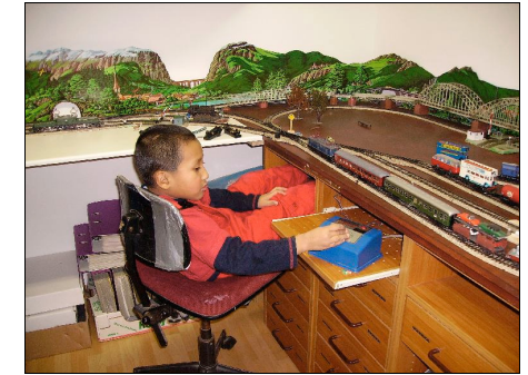
Der „coole“ Fahrdienstleiter

mitfahren oder Ladegüter umgeladen werden!