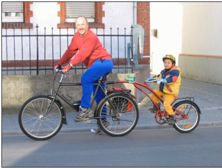
Ein flotter Zweier

eingeladen, sich bei einem Besuch bei uns in Oppenheim persönlich davon zu überzeugen!