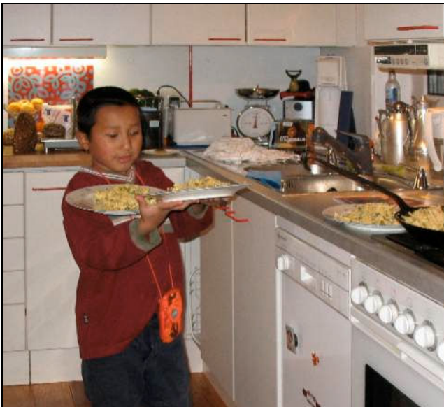
Dem Kellner im Restaurant abgeguckt!

Eine Wochenendreise führte dann unsere Familie im Mai nach München. Wir haben ein Familienzimmer in der Jugendherberge belegt und ausgiebig das Deutsche Museum genossen. Dort gibt es auch für Kinder tolle Programme. Man sollte aber Wäsche zum Wechseln mitnehmen - so interessant sind dort die Wasserspiele in der Kinderabteilung - immerhin gibt es dort auch Haar- und Wäschetrockner!