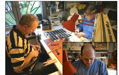
In der Werkstatt

Eine „Spätfolge“ unserer Ungarnreise war im Herbst ein Werkstattwochenende mit Modellbahnfreunden (aus der Gruppe, die auch zu meinem 50. Geburtstag die Modellbahn aufgebaut hatte). Wir haben uns gemeinsam an den Bau von Modellen einer sehr charakteristischen ungarischen Schmalspurlokomotive gemacht. Da lief in meiner Werkstatt eine regelrechte Kleinserienproduktion an - fast wie in einer kleinen Fabrik!