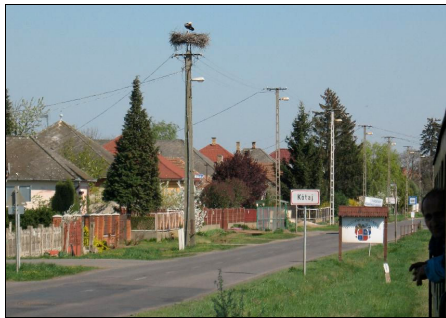
Störche an der Kleinbahn von Niyregyhaza