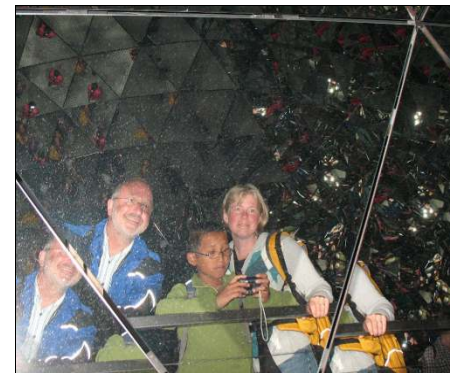
Staunen im Kristall-Spiegel-Palast