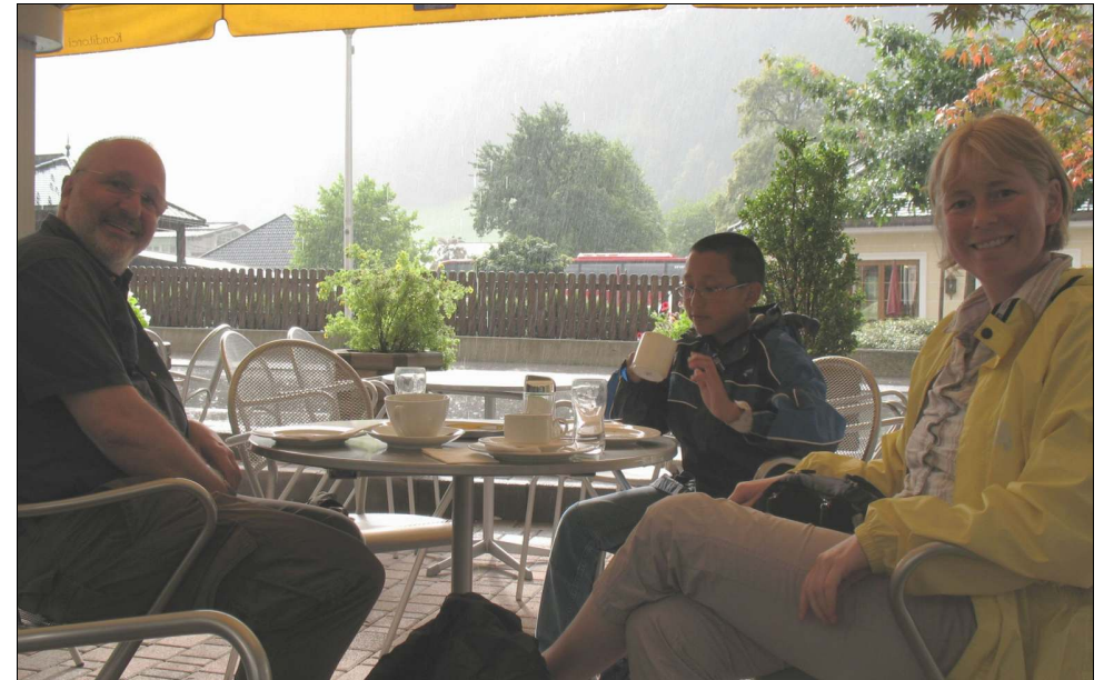
Wanderpause in Österreich, draußen mit Regenschauer!

FRIEDRICH-EBERT-STRASSE 38 D-55276 OPPENHEIM/RHEIN ☎ 0 61 33 – 12 13 ☎ PRAXIS – 12 50 eMail: weknopf@t-online.de heike.knopf@t-online.de carlos.knopf@wek-bahn.com Bahn: www.wek-bahn.com Praxis: www.zahnknopf.de