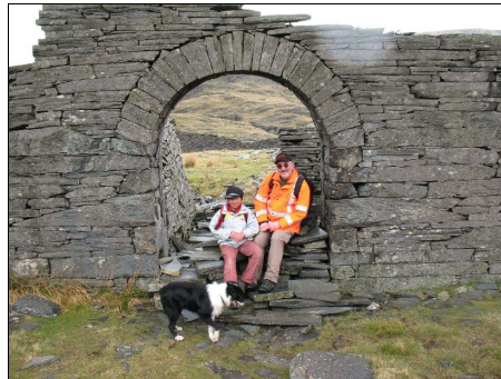
Trocken gemauertes Schiefergebäude