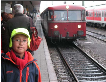
Schienenbus vor der Abfahrt

wird sich sicher fragen, wo die Bahngesellschaft EK ihren Verkehr abwickelt. Ein Klick auf die dort angegebene Web-Adresse wird dann wohl bald für Aufklärung sorgen!